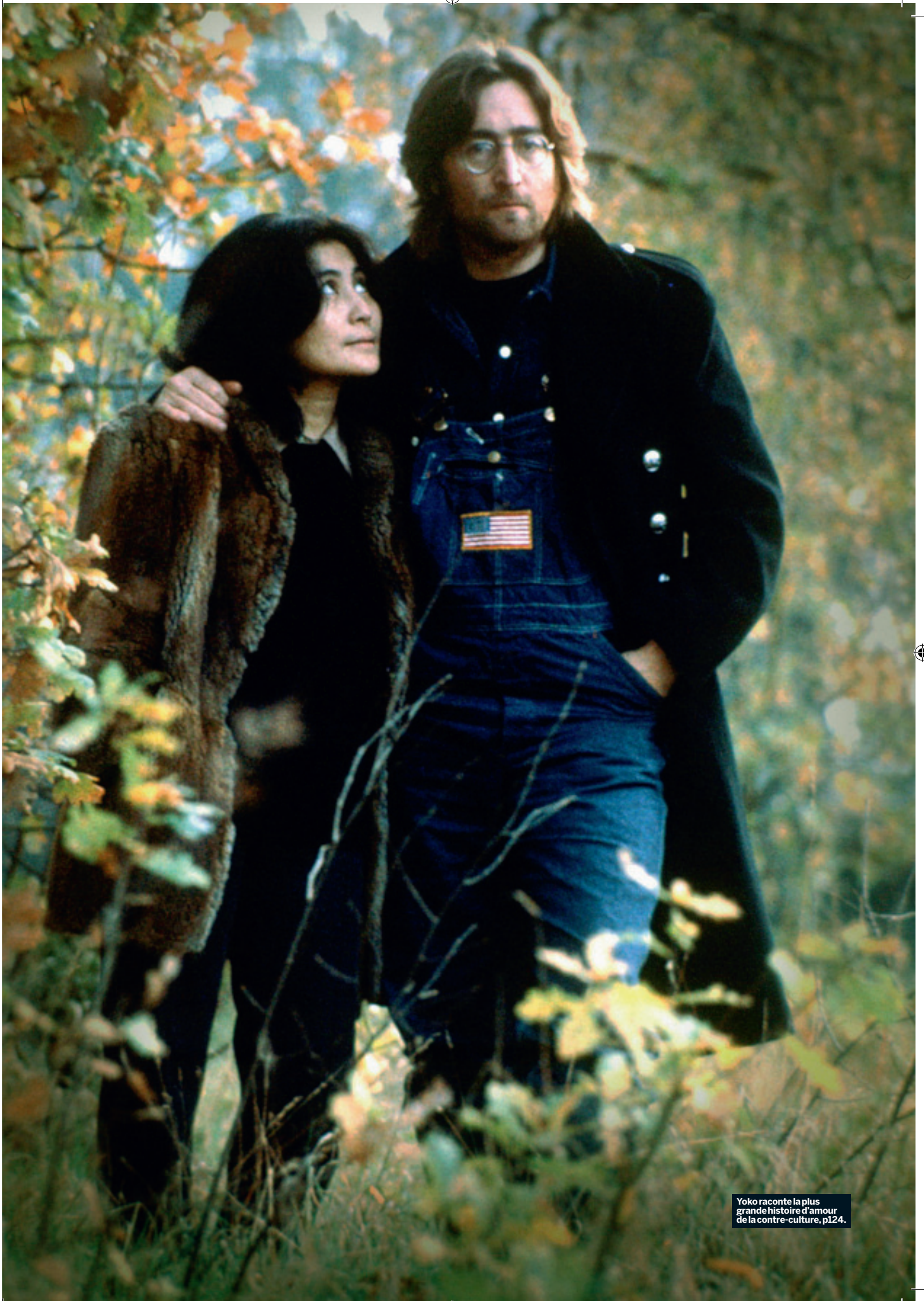
Yoko raconte la plus grande histoire d'amour de la contre-culture, p124.