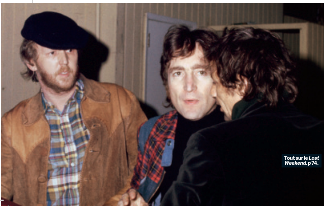
Tout sur le Lost Weekend , p 74.